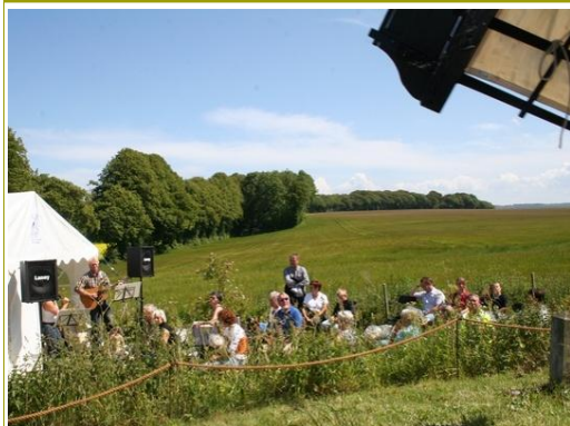
Mølledag på Havnø Mølle. Se billederne her >

Den 21. juni 2009 afholdtes Dansk Mølledag for 16. gang. Jeg har fundet omtale af begivenheden i nogle danske aviser. Se her >